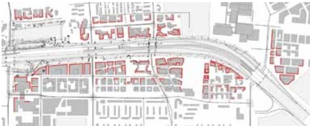
figuur 3.3 Boven de maximale ontheffingswaarde geluidbelaste gevels in de referentiesituatie als gevolg van de A10

Het realiseren van een hoogwaardige toplocatie met een gemengd stedelijk milieu in de directe nabijheid van hoofdinfrastructuur staat op gespannen voet met elkaar, ondanks dat hoofdinfrastructuur wel randvoorwaardelijk is voor een internationale toplocatie. Dit wordt versterkt door de groei van het autogebruik en in mindere mate van het spoorvervoer in dit gebied. Dit noodzaakt tot een robuuste inpassing van infrastructuur, zodat naast groei op deze infrastructuur ook de milieuhinder voor woningen, kantoren, voorzieningen en de openbare ruimte verminderd kan worden.