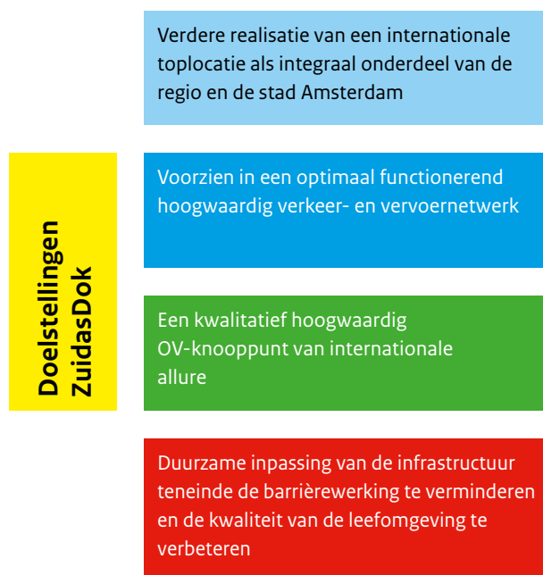
figuur 3.1 Centrale doelstellingen voor ZuidasDok

De ontwikkeling van ZuidasDok is belangrijk om de bereikbaarheid van de Noordvleugel van de Randstad en Zuidas op alle schaalniveaus te waarborgen en geeft bovendien een stevige impuls aan de doorgroei van Zuidas tot een internationale toplocatie met een gemengd stedelijk milieu. ZuidasDok voorziet in een samenhangend antwoord op de verschillende deelproblemen in het gebied. Voor ZuidasDok zijn vier doelstellingen geformuleerd, zoals weergegeven in figuur 3.1.