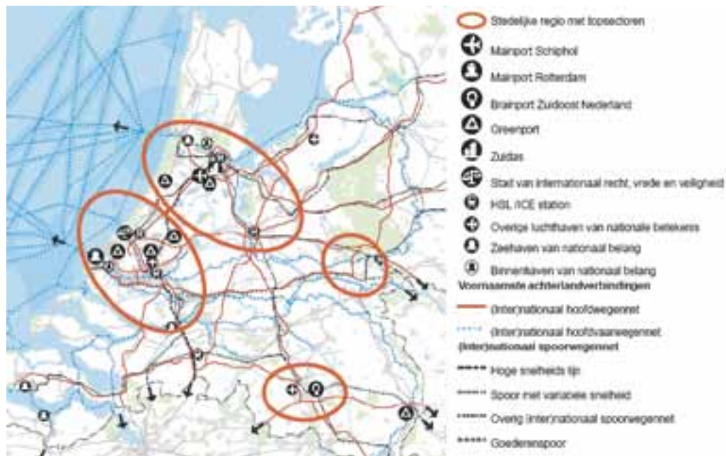
figuur 2.1 Stedelijke regio's met de diverse topsectoren uit de ontwerp Structuurvisie Infrastructuur en Ruimte

Om te zorgen dat de Noordvleugel, in het bijzonder de corridor Schiphol - Amsterdam - Almere goed bereikbaar blijft zijn aanpassingen aan de infrastructuur (auto, trein en metro) noodzakelijk. Momenteel zijn of worden diverse planstudies uitgevoerd om het rijkswegennet robuuster te maken. In het kader van OV-SAAL (Schiphol-Amsterdam-Almere-Lelystad) worden diverse uitbreidingen en verbeteringen op het spoor doorgevoerd. Naast bereikbaarheid dienen ook hoogwaardige (economische) functies versterkt en uitgebreid te worden. Hiermee wordt de internationale concurrentiekracht vergroot en de economische positie van Nederland in Europa en de rest van de wereld versterkt.