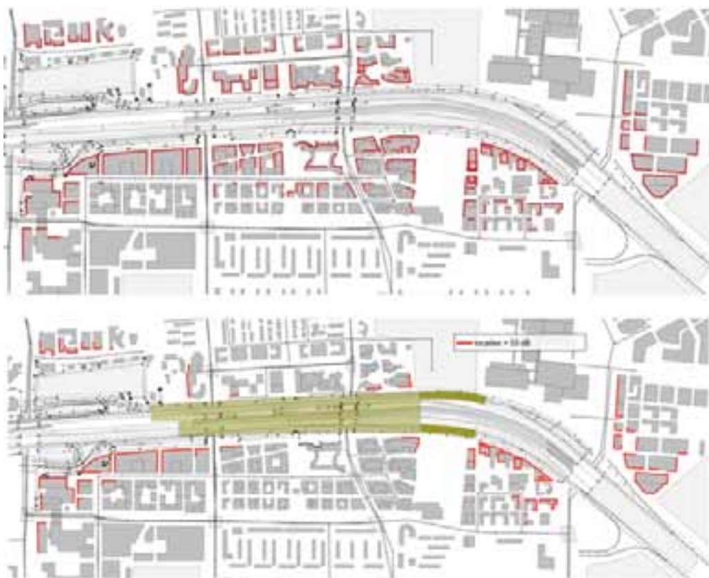
figuur 5.4 Gevels met een geluidbelasting boven de maximale ontheffingswaarde A10 zonder (boven) en met de realisatie van de beleidskeuzes (onder)

De A10-tunnel zal uit vier tunnelbuizen bestaan. Per rijrichting wordt een tunnelbuis met vier rijstroken voor het doorgaande verkeer gerealiseerd, inclusief vluchtcompartiment en een tunnelbuis met een rijstrook en een weefvak voor het bestemmingsverkeer. De noordelijke tunnelbuizen, bestemd voor het verkeer vanaf knooppunt Amstel richting knooppunt De Nieuwe Meer, hebben een lengte van circa 1.100 meter. De zuidelijke tunnelbuizen, bestemd voor het verkeer vanaf knooppunt De Nieuwe Meer richting knooppunt Amstel, hebben een lengte van circa 1010 meter. Dit verschil in lengte is het gevolg van een verschillende ligging van de tunnelmonden aan de westzijde van de tunnel. De zuidelijke tunnelbuizen zijn hier circa 90 meter korter om het invoegen op de rijbanen voor het bestemmingsverkeer voor het begin van de tunnel te laten plaatsvinden.