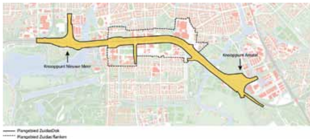
figuur 1.1 Plangebied ZuidasDok en ligging van Zuidas Flanken