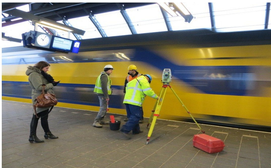
Werken op het perron Station Rai

het ware met de schoenlepel moeten worden ingepast. Zelfs in de vrieskou stond er in week 4 groot en ingrijpend werk gepland voor deze spooruitbreiding. Op diverse locaties waren aannemers tegelijk bezig. Hierdoor was treinverkeer niet mogelijk tussen Schiphol en Diemen Zuid. Planning van zulk groot spoorwerk gebeurt lang van tevoren, want het heeft niet alleen grote impact op het drukbereden Nederlandse spoor, maar ook op de strakke planning die dit project kenmerkt. Gelukkig heeft het weer dit weekend maar beperkt roet in het eten gegooid. Alleen de heiwerkzaamheden zijn uitgesteld. Er wordt nu naarstig naar een alternatieve periode gezocht.