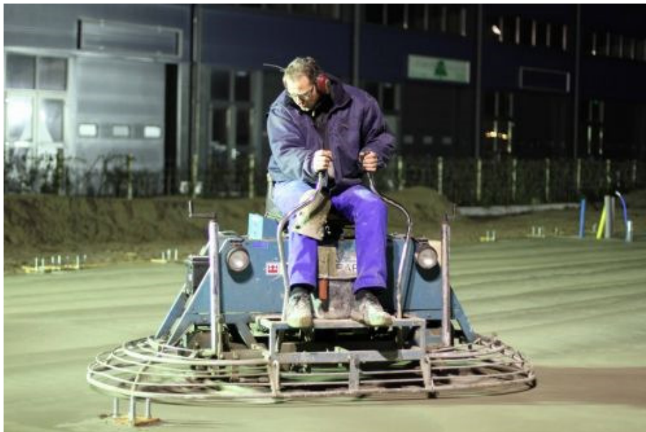
Afbeelding: het vlinderen van betonmortel

De verwachting is dat we medio september klaar zijn met de kelder en dat daarna de damwanden worden getrokken. Ook , hierover wordt u nader ingelicht.